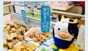
昨年度のグランプリ 株式会社 べつかい乳業興社