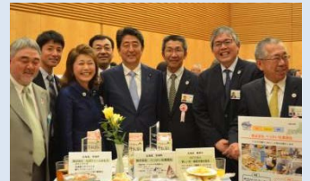
昨年度の交流会の様子

農山漁村の有するポテンシャルを引き出すことにより地域の活性化、所得向上に取り組んでいる優良事例を選定し、全国に発信するものです。優良事例を20地区程度選定し、この優良事例の中からグランプリ1件、特別賞3件程度を選定します。選定された地区の代表者等は都内で開催する交流会に招待されます。